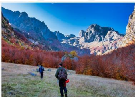
Grebaje valley.

Kreirana je i sedmodnevna turistička ruta za sve one koji žele na jedinstven način da otkriju neke od najčuvanijih tajni prekogranične zone Crne Gore i Kosova. Za više informacija, kliknite ovdje